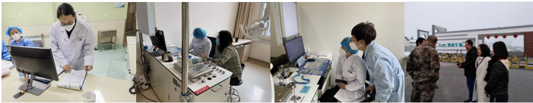
专业教师赴企业进行技术培训