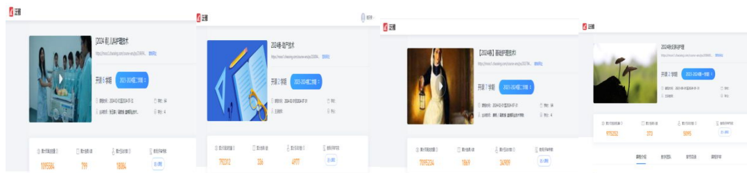
表 5-2 泛雅平台部分专业课程建设应用情况