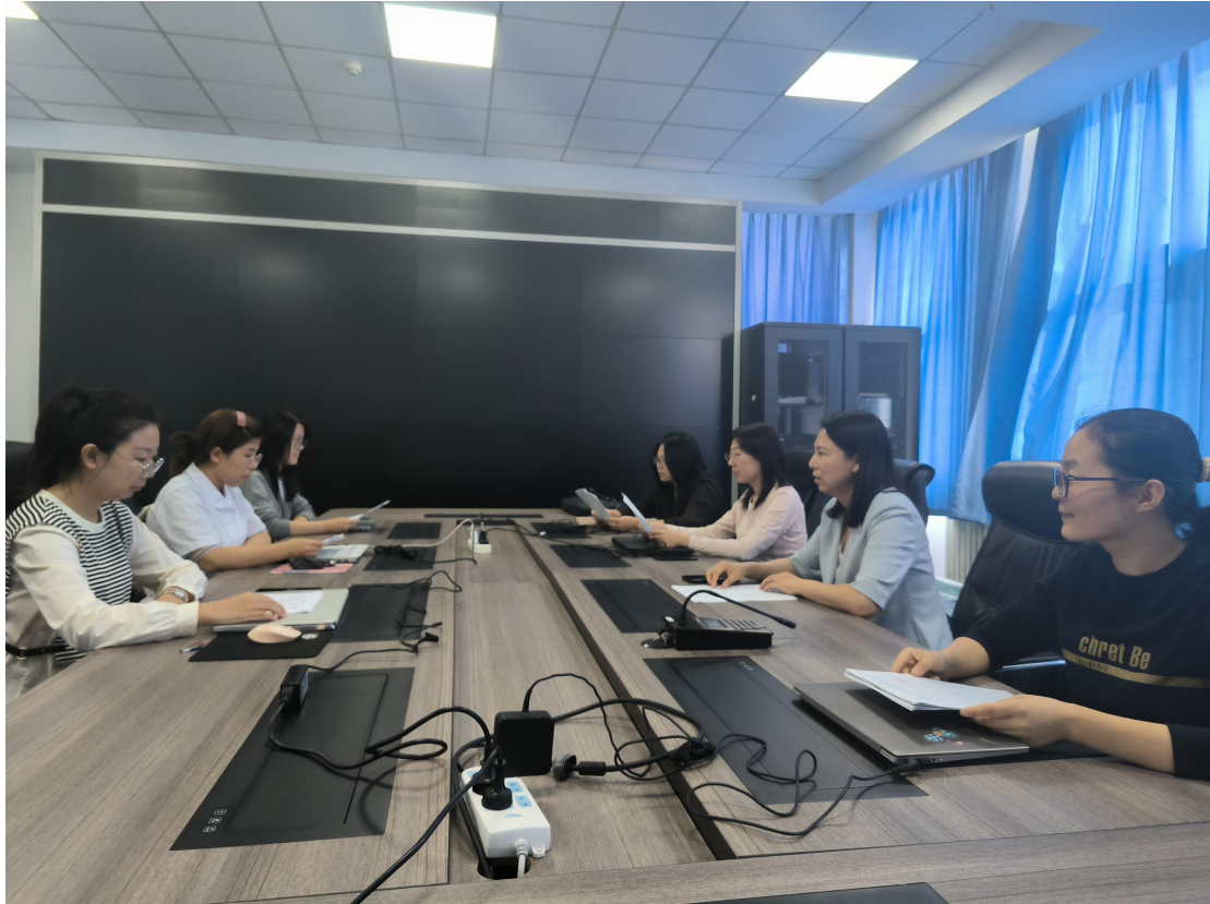
相关人员定期研讨人才培养方案

新的培养目标发布后，及时组织教师制定具体的教学计划和课程体系，确保培养目标的有效实施。建立培养目标实施情况的评估机制，定期对培养目标的达成情况进行评估和反馈，及时发现问题并进行调整和改进。