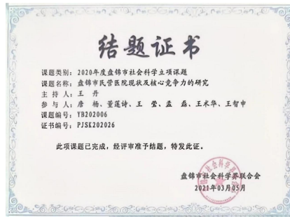
专业教师主持课题研究，为企业发展提供解决方案