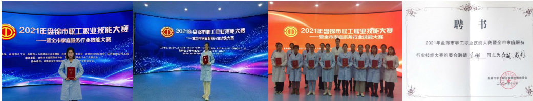
专业教师担任盘锦市职工职业技能大赛评委