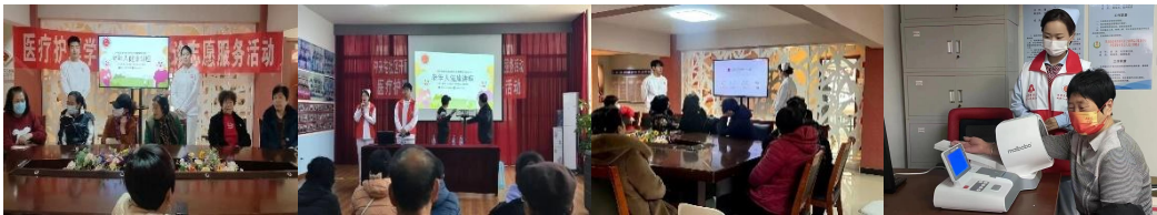
助产专业教师和学生进社区等地进行健康知识宣讲和义诊活动